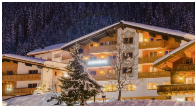
Wellness und Genuss direkt an der Piste in Lech am Arlberg – dafür steht das Vier-Sterne-Hotel Anemone.