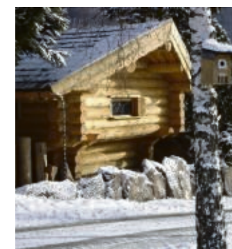
Den Winter von seiner schönsten Seite kennenlernen: Im Hotel Freund im Land der Seen und Berge am Edersee gelingt das sehr gut.