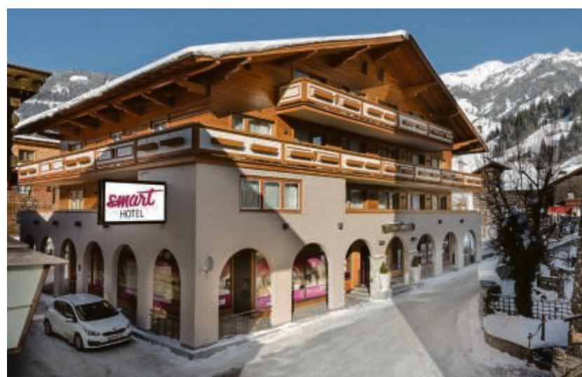
Kraft tanken & smart erleben: Das Hotel bietet beste Voraussetzungen für einen entspannten Winterurlaub im Salzburger Land.