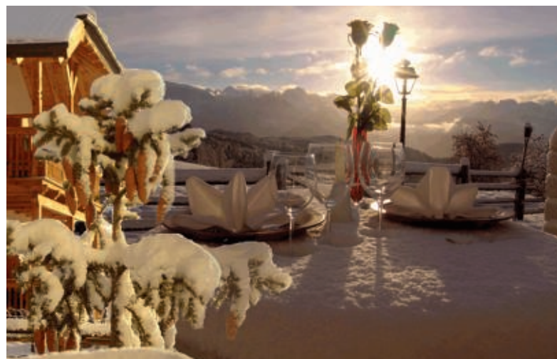
Eine Oase der Ruhe: Der Geyrerhof bietet einen grandiosen Panoramablick auf das Weltnaturerbe der Dolomiten. Das Hotel kombiniert den rustikalen und urgemütlichen Charme eines Bergbauernhofes mit dem Komfort eines modernen Hotels.